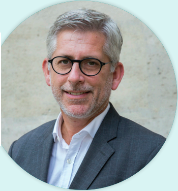
Frédéric Valletoux Président de la Fédération hospitalière de France

L orsqu'un enfant malade est hospitalisé, professionnels et parents sont animés d'une même volonté : agir en partenaires dans un respect mutuel, de sorte que l'enfant soit traité le mieux possible en veillant à protéger son équilibre psychologique et à respecter ses droits.